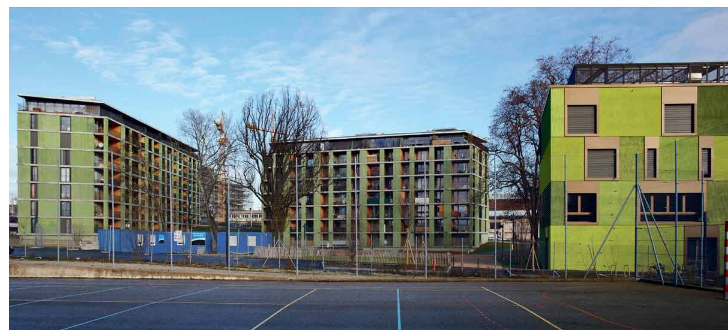
Foyer Sécheron – Construction d'un nouveau quartier intégrant près de 120 logements, un EMS et un Espace de quartier.

Offrir des logements et un cadre de vie de qualité aux habitants du canton et à leurs enfants est une priorité. Ces logements seront réalisés dans des quartiers mixtes, bien desservis par les transports publics, afin que la population puisse y trouver les services et les équipements publics répondant à ses besoins. Pour atteindre cet objectif, le canton et les communes réalisent plusieurs grands projets de développement urbain comme La Chapelle-Les Sciens, les Vergers, les Cherpines, les Grands Esserts, Bernex et le projet Praille Acacias Vernets (PAV). Afin de faciliter l'accès au logement pour tous, la loi pour la construction de logement d'utilité publique (LUP) fixe pour objectif à l'Etat de constituer un parc pérenne de logements à caractère social à hauteur de 20% du parc locatif du canton.