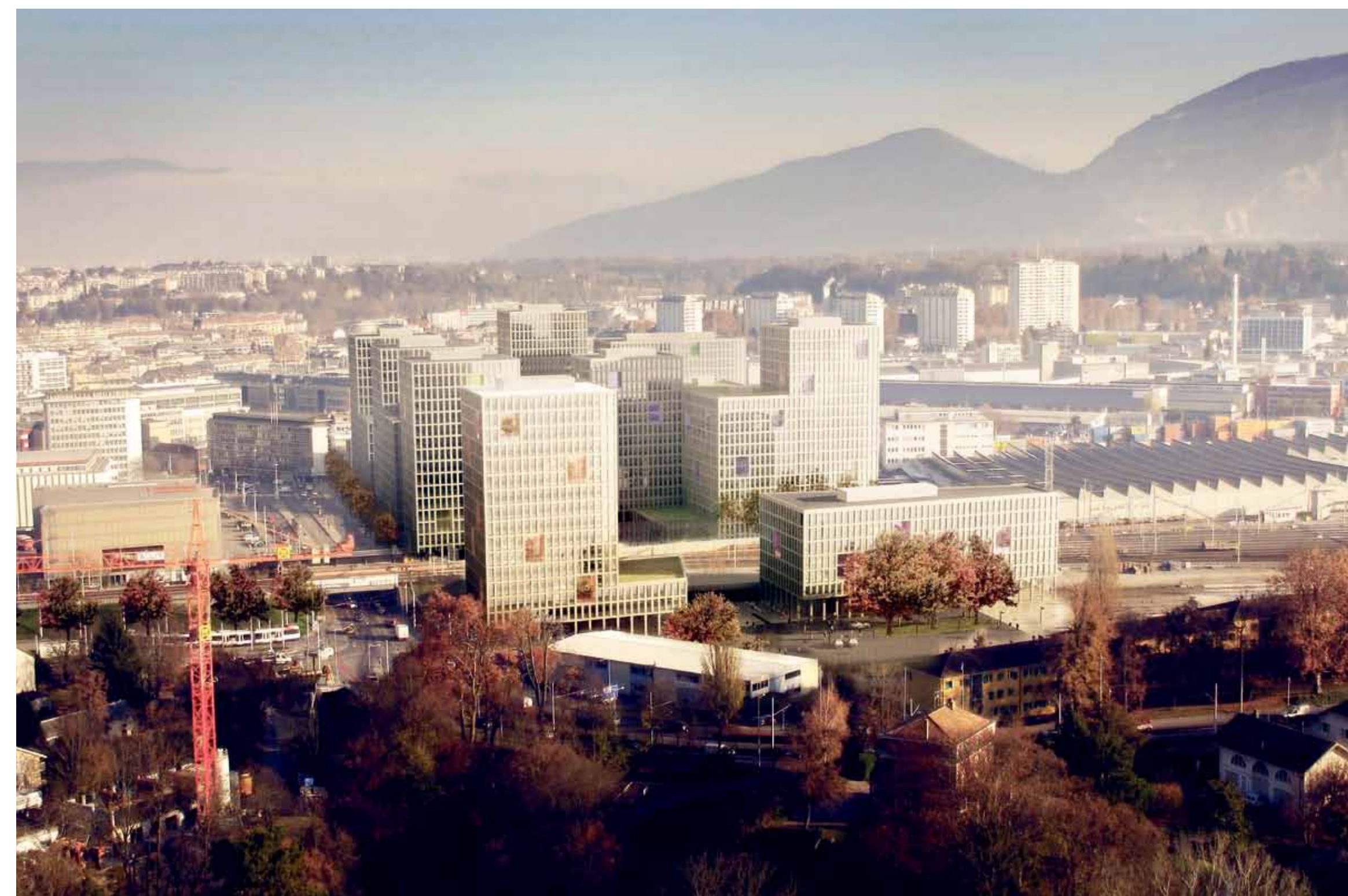
Concours d'architecture et d'espaces publics gare CEVA de Lancy - Pont - Rouge (janvier 2012), © Pont 12 Architectes SA

A travers les concours, l'Etat, la Ville et les communes se sont donné les moyens de concevoir ensemble des espaces publics de qualité autour des futures stations CEVA. Les logements, les surfaces d'activités et les lieux culturels qui seront réalisés à proximité de CEVA feront de ces nouvelles «places de la gare» des espaces de vie autant que des lieux de transbordement entre divers modes de transport.