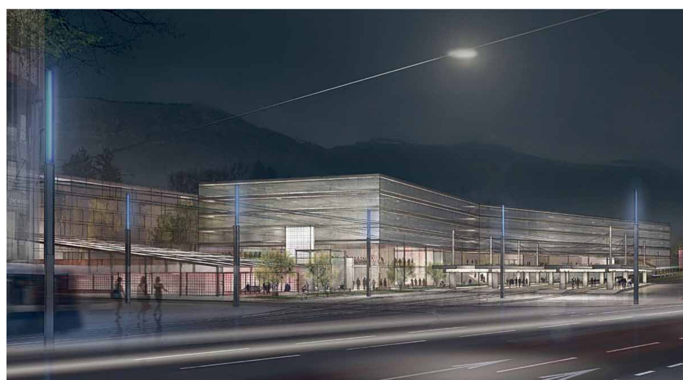
Concours d'espaces publics halte CEVA Carouge-Bachet (avril 2012), © msv architectes urbanistes