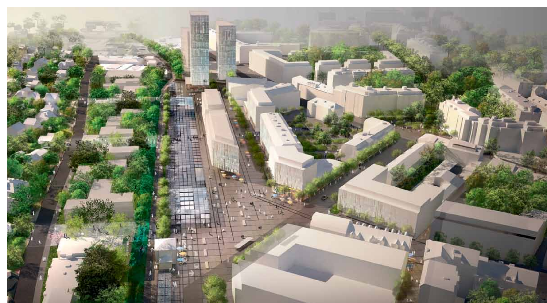
Concours d'espaces publics halte CEVA Chêne-Bourg (novembre 2011), © EMA Architectes, ILEX SAS, INGPHI SA