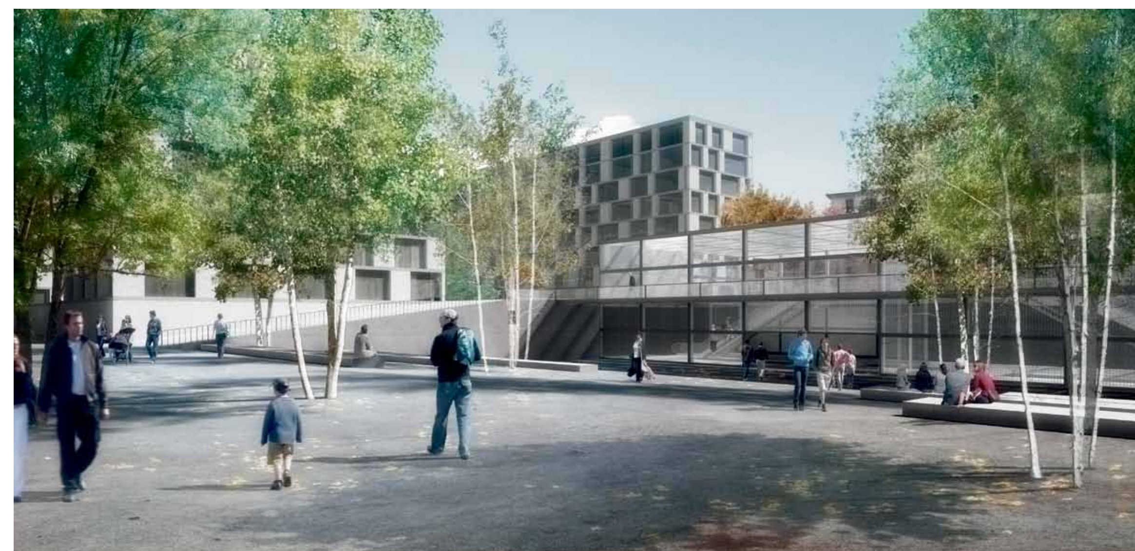
Création d'une centralité urbaine à la gare CEVA des Eaux-Vives comportant des logements, des activités, des équipements de quartier et la Nouvelle Comédie de Genève autour d'une interface de transports performante. Concours d'espaces publics gare CEVA des Eaux-Vives, Ville de Genève (décembre 2010)

Ces nouvelles centralités urbaines offriront des logements, des surfaces d'activités ainsi que des équipements et des espaces publics.